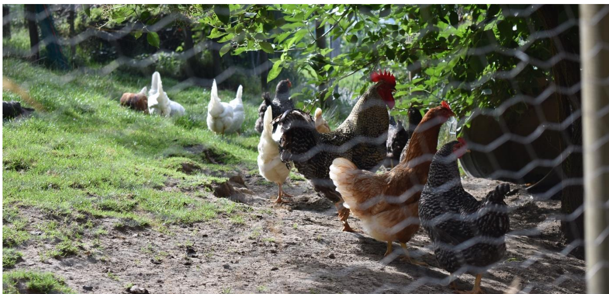
Image 5 : parcours extérieur offrant de l'ombre naturelle, de la terre pour les bains de poussière ainsi que de l'herbe pour explorer et picorer.

Le poulailler doit être éclairé par la lumière du jour et l'intensité d'éclairage minimale ne doit pas être inférieure à 5 lux, mais devrait idéalement être plus élevée, voir art. 33 et 67 OPAn.