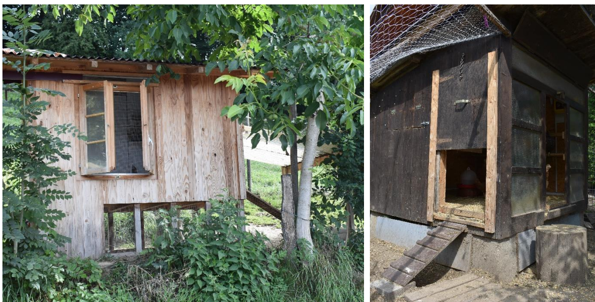
Image 2 : Deux exemples de poulaillers avec de grandes ouvertures pour laisser entrer la lumière et ventiler. L'avant-toit du poulailler de gauche peut être fermé sur les côtés avec du grillage pour en faire un jardin d'hiver. Le parcours extérieur du poulailler de droite est recouvert d'un filet.

La densité d'occupation optimale dépend entre autre de la grandeur et de la stabilité du groupe social. Pour les petits groupes de 2 à 15 animaux nous recommandons de ne pas dépasser 4 poules / m 2 .