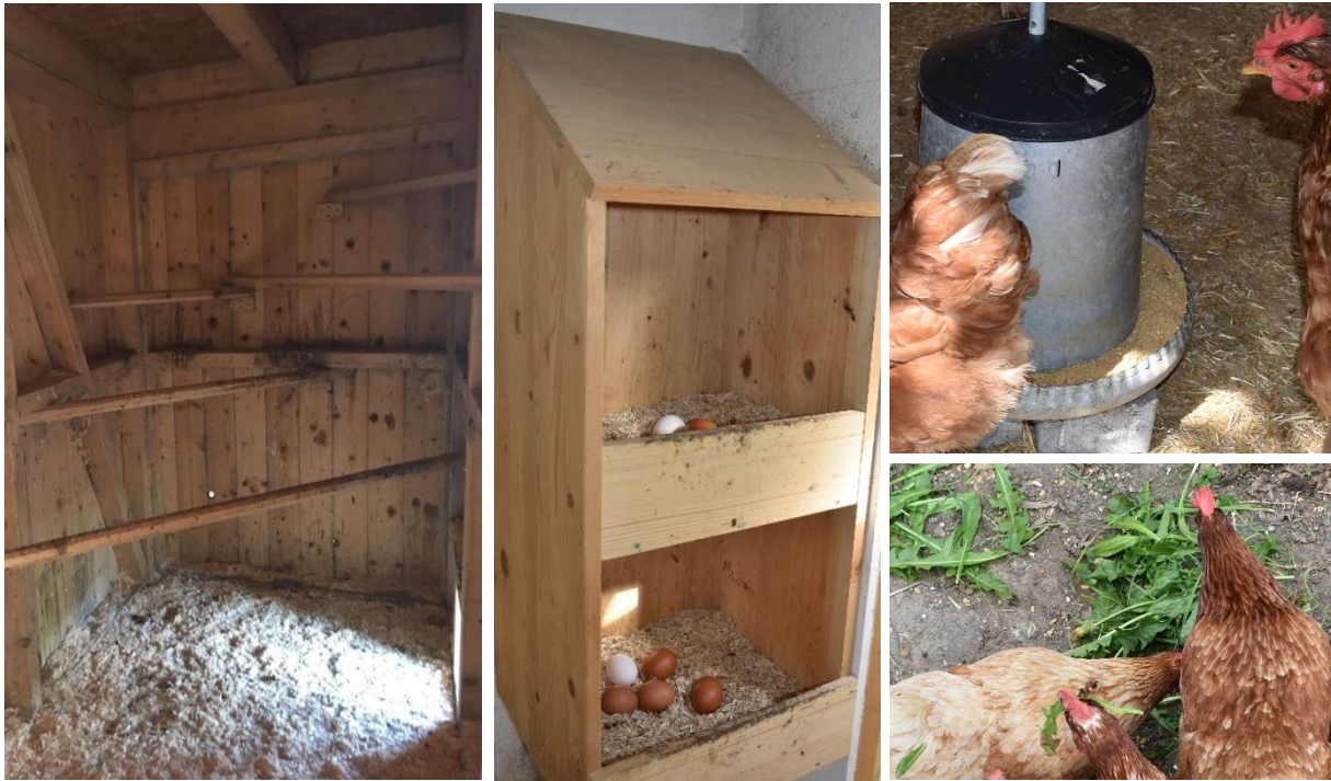
Image 3 : Sur la première photo on voit cinq perchoirs montés à différentes hauteurs. La photo du milieu montre deux pondoirs, fermés sur trois côtés et sur le dessus et pourvus de litière. A droite en haut on voit un exemple de mangeoire circulaire et en bas, des dents-de-lion et des graines données aux poules comme complément.